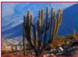
▲ Die Atacama-Wüste im Norden des Landes gehört zu den trockensten Regionen der Welt.