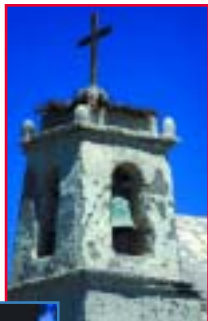
Spanische ▲ Missionare verbreiteten im 17. Jahrhundert den christlichen Glauben.