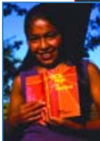
◄ Chilenisches Mädchen mit Neuem Testament auf Spanisch.

Das rund 4.230 Kilometer lange und durchschnittlich nur 176 Kilometer breite Chile erlangte 1818 die Unabhängigkeit von Spanien. Aufgrund seiner vorbildlichen Wirtschaftspolitik gilt Chile heute als lateinamerikanischer Musterstaat, doch nicht alle Einwohner des Landes haben Anteil am nationalen Wohlstand. So leben die Menschen in den Elendsvierteln der 5-Millionen-Stadt Santiago unter erbärmlichen Bedingungen.